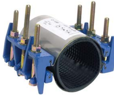
Ref.1406 Type D (Jonction définitive) 3 Tirantsx2,Longueur 200mm