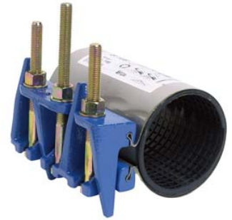
Ref.1401 Type M (Réparation) 1 Tirant, Longueur 80mm